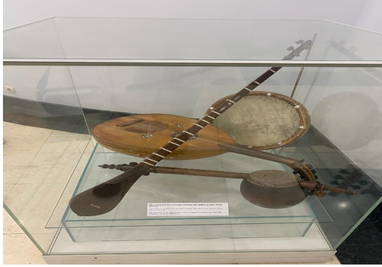
Şekil: Gur-ı Emir Timur Türesi-Semerkan